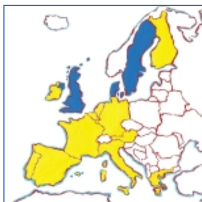
Les 12 pays de la zone euro

• Dans les territoires d'outre-mer (Polynésie, Nouvelle Calédonie...), on continuera à utiliser le franc pacifique (franc CFP), car ils ne font pas partie de l'Union Européenne.