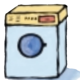
Machine à laver le linge*